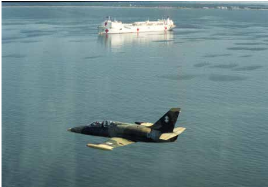
Tarptautinės pratybos „Nordic Peace“, 1998 m. International Exercise Nordic Peace, 1998.