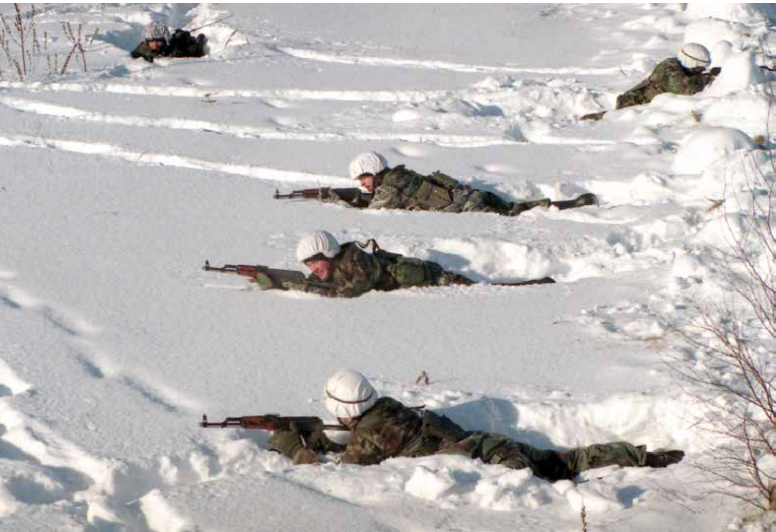
Per BALTBAT pratybas. 1996 m. vasario 10 d. At a BALTBAT exercise. 10 February 1996