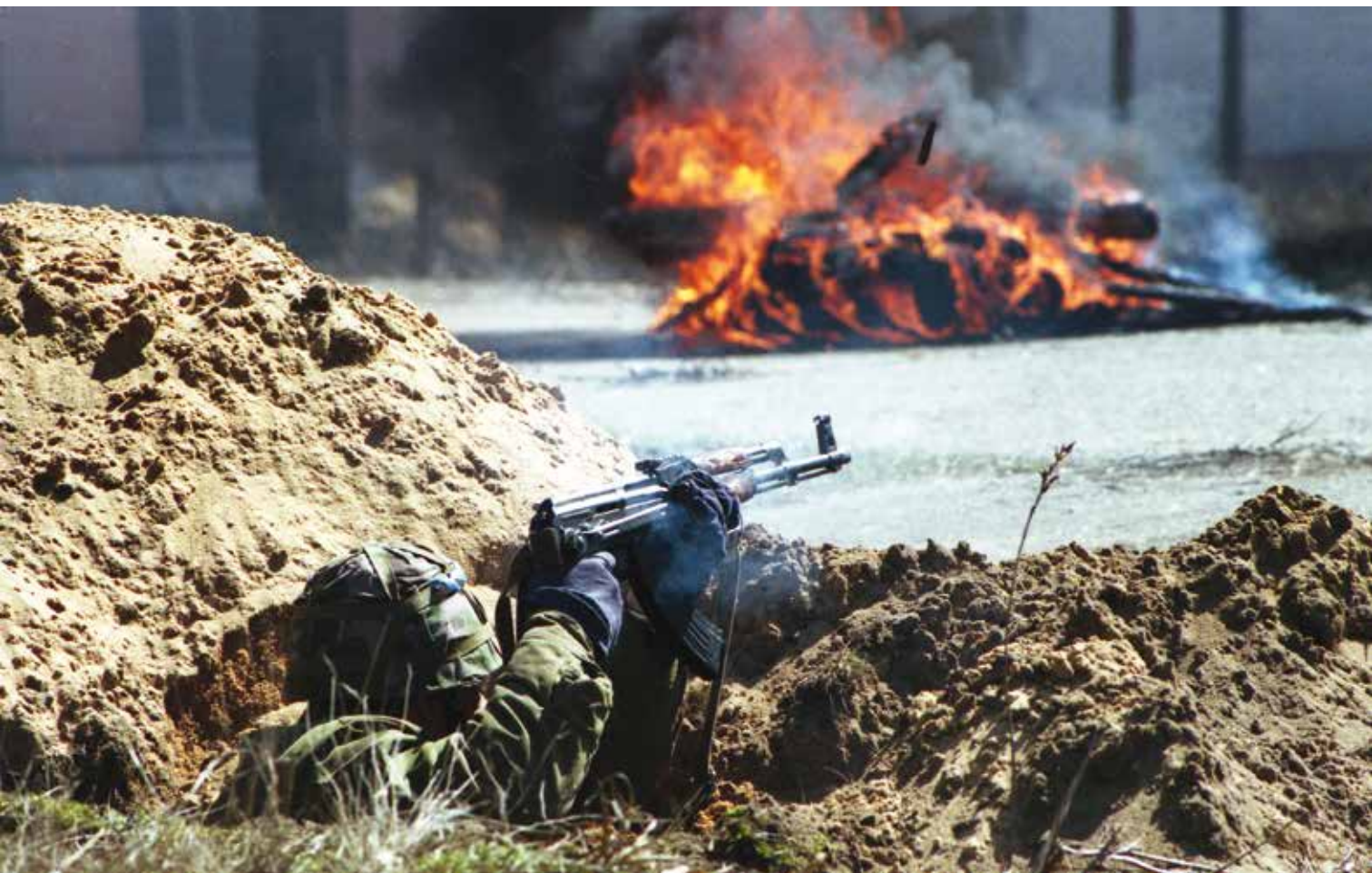
Pratybos „Gintarinis slėnis“. 1997 m. balandis Exercise Amber Valley. April 1997