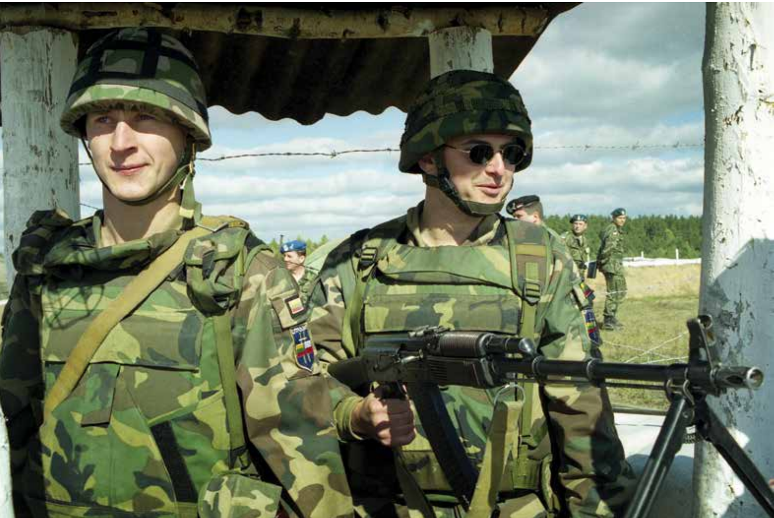
LITPOLBAT pratybos. 1999 m. A LITPOLBAT exercise. 1999.