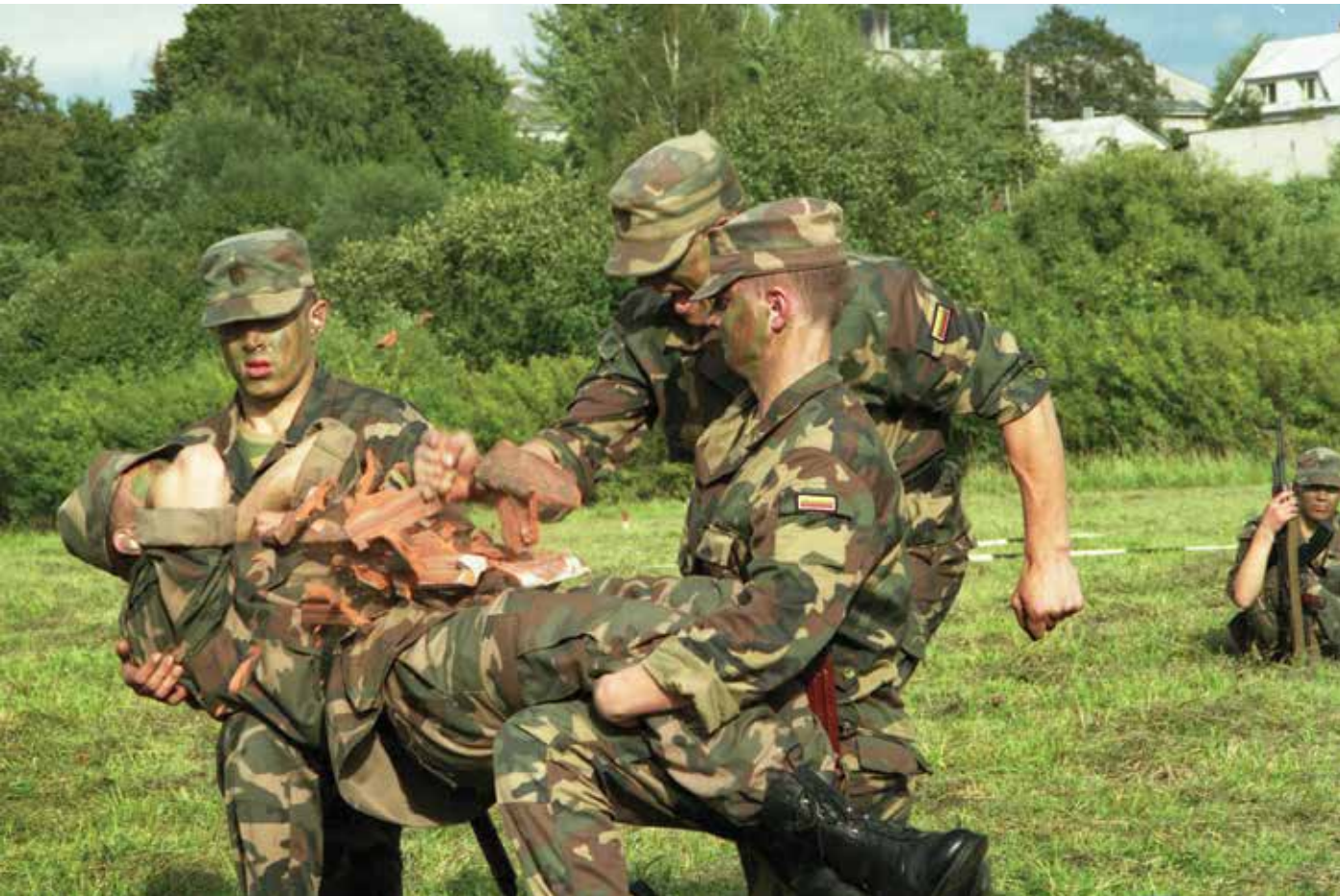
Per parodomąsias pratybas. 1999 m. A dynamic display, 1999 m.