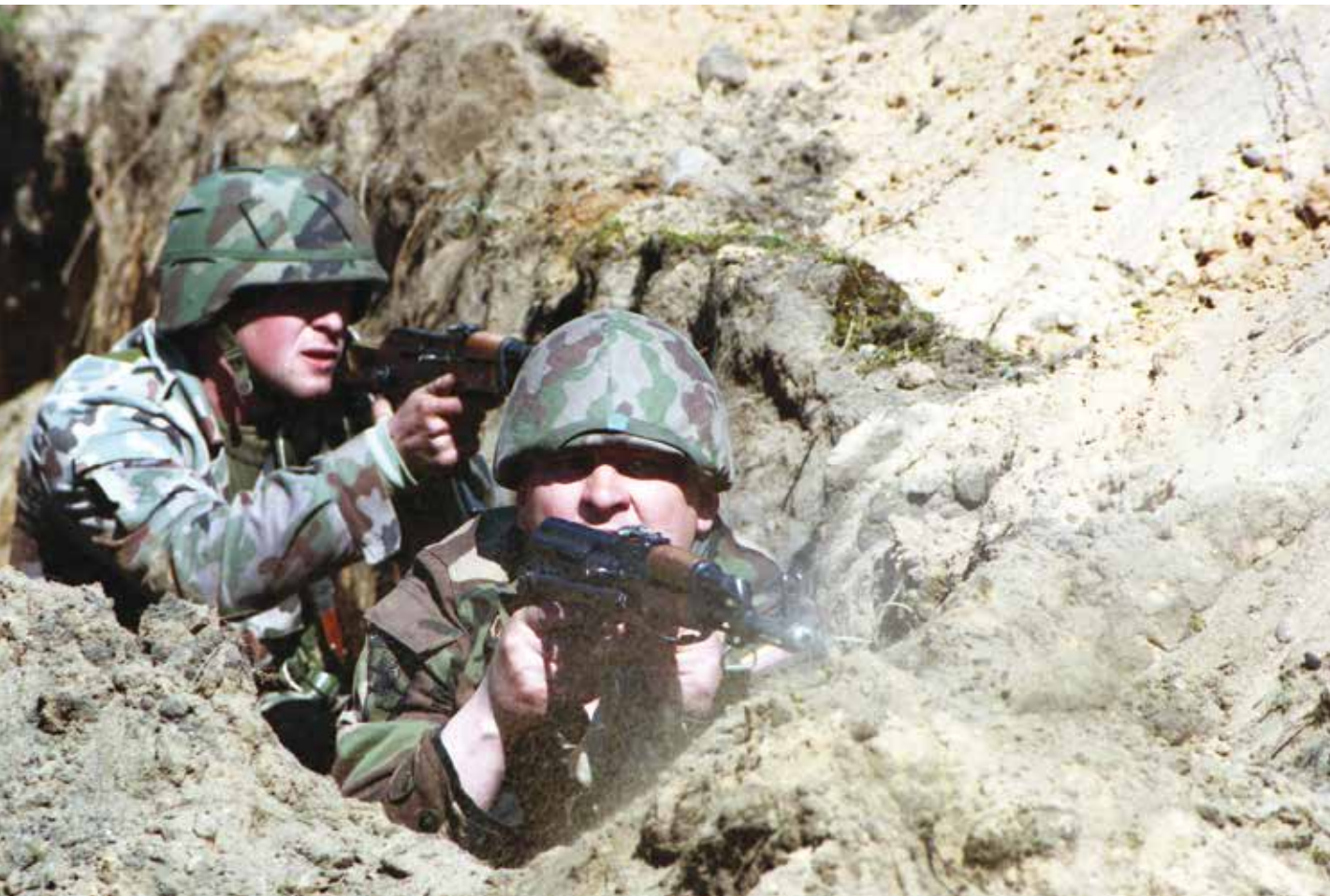
Pratybos „Gintarinis slėnis”. 1997 m. balandis Exercise Amber Valley. April 1997