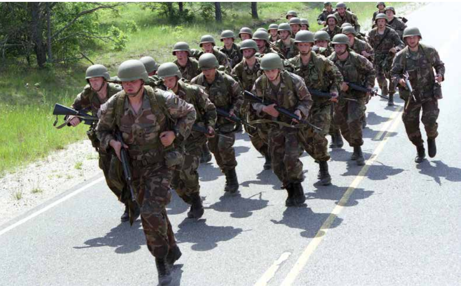
Lietuvos kariai pratybose Luizianoje. Jungtinės Amerikos Valstijos, 1995 m. Lithuanian soldiers at an exercise in Louisiana, the United States of America, 1995.