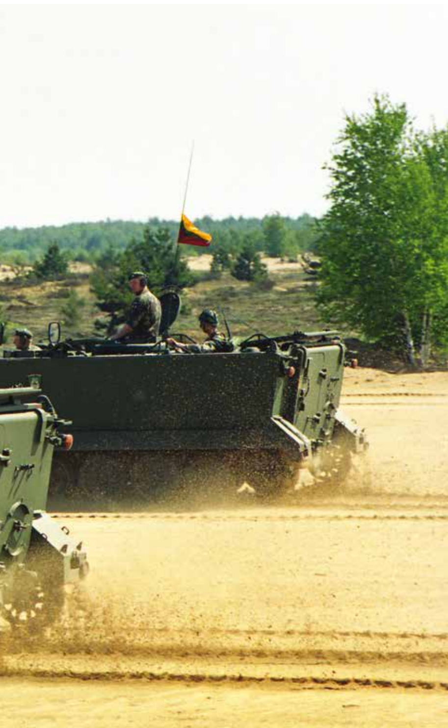
Jėgerių pratybos Gaižiūnų poligone. 2001 m. gegužė A jaeger exercise at the Gaižiūnai Training Area. May 2001