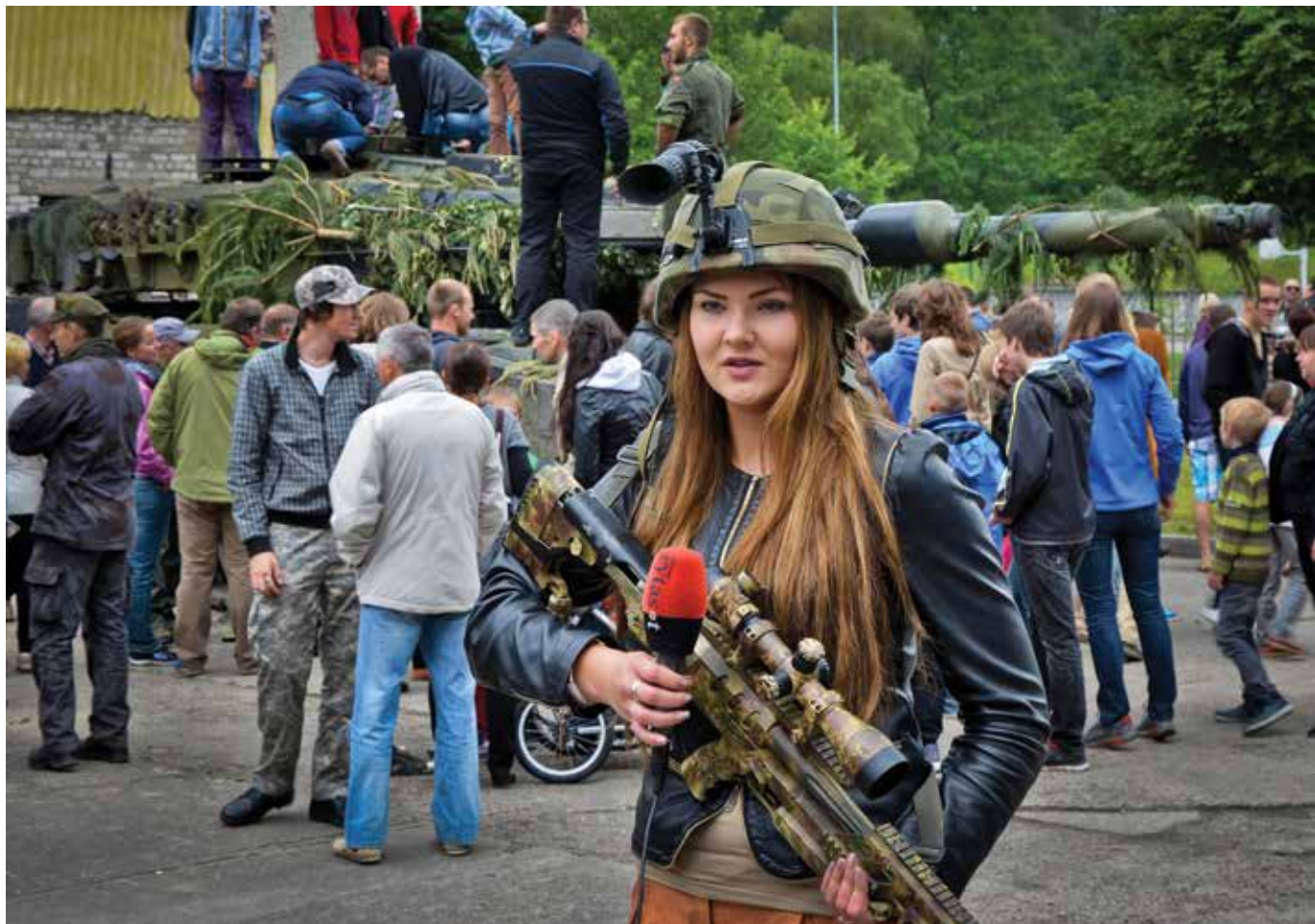
Vainius Eiva Koviniam reportažui pasiruošta. Per tarptautines pratybas „Kardo kirtis 2014“, visuomenės diena, 2014 m. birželis Full combat readiness for a combat report. DV Day at Exercise Saber Strike 2014. June 2014