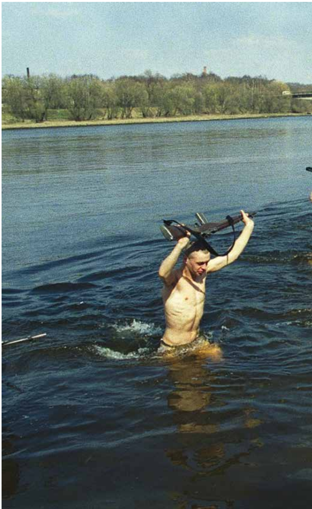
Jėgeriai patrulio kurso metu. 2002 m. balandis Jaegers on a patrol course. April 2002