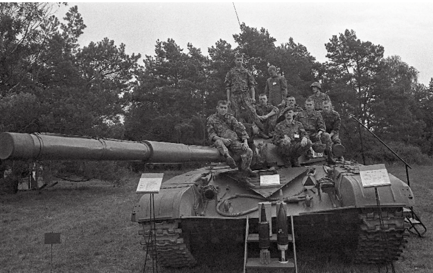
Pratybos Rūdninkų poligone. 1993 m. birželio 2 d. An exercise at the Rūdninkų Training Area. 2 June 1993.