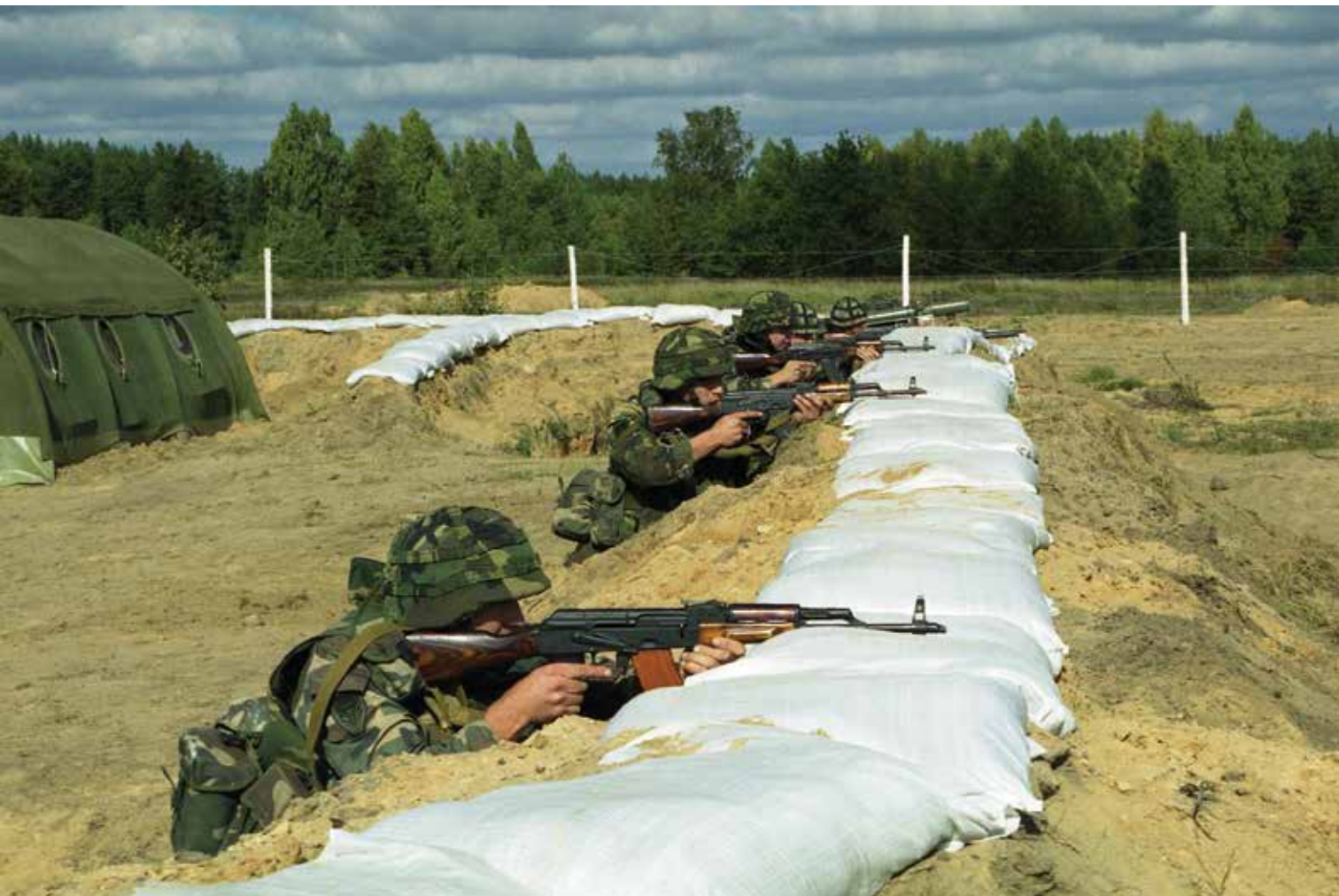
LITPOLBAT pratybos. 1999 m. A LITPOLBAT exercise. 1999.