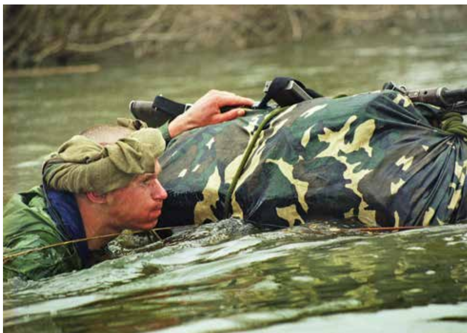
Jėgeriai patulio kurso metu. 2002 m. balandis Jaegers on a patrol course. April 2002