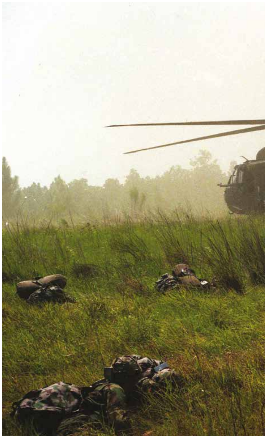
Lietuvos kariai pratybose Luizianoje. Jungtinės Amerikos Valstijos, 1995 m. Lithuanian soldiers at an exercise in Louisiana, the United States of America, 1995.