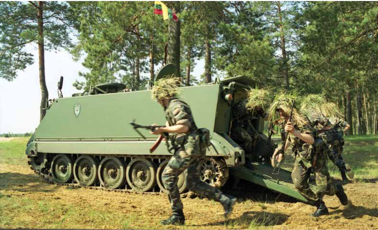
Jėgerių pratybos Gaižiūnų poligone. 2001 m. gegužė

A jaeger exercise at the Gaižiūnai Training Area. May 2001