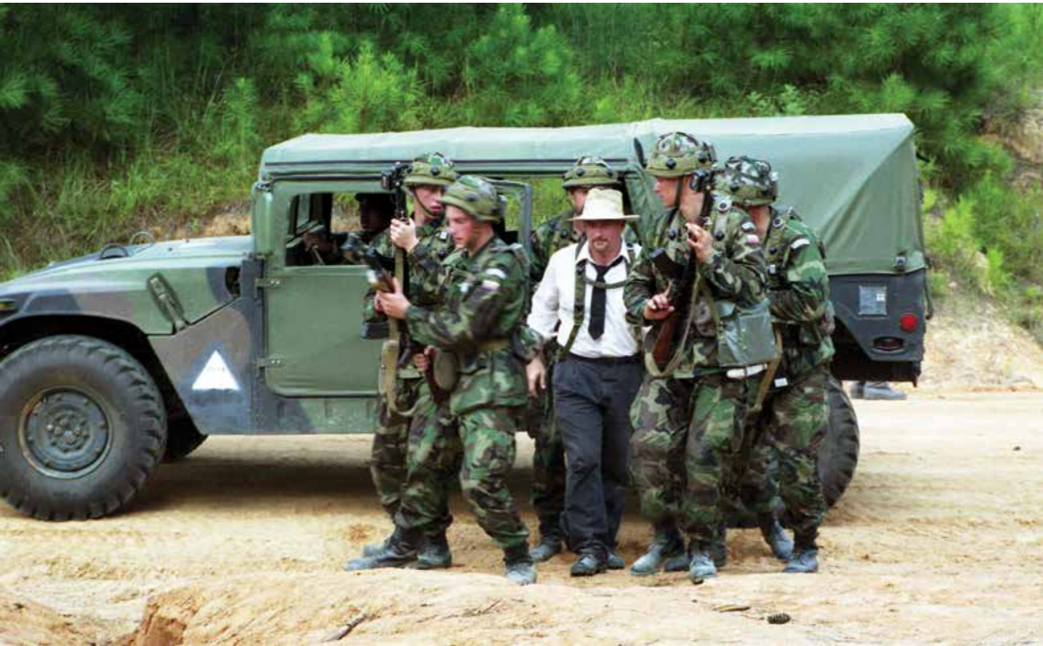
Lietuvos kariai pratybose Luizianoje. Jungtinės Amerikos Valstijos, 1995 m. Lithuanian soldiers at an exercise in Louisiana, the United States of America, 1995.