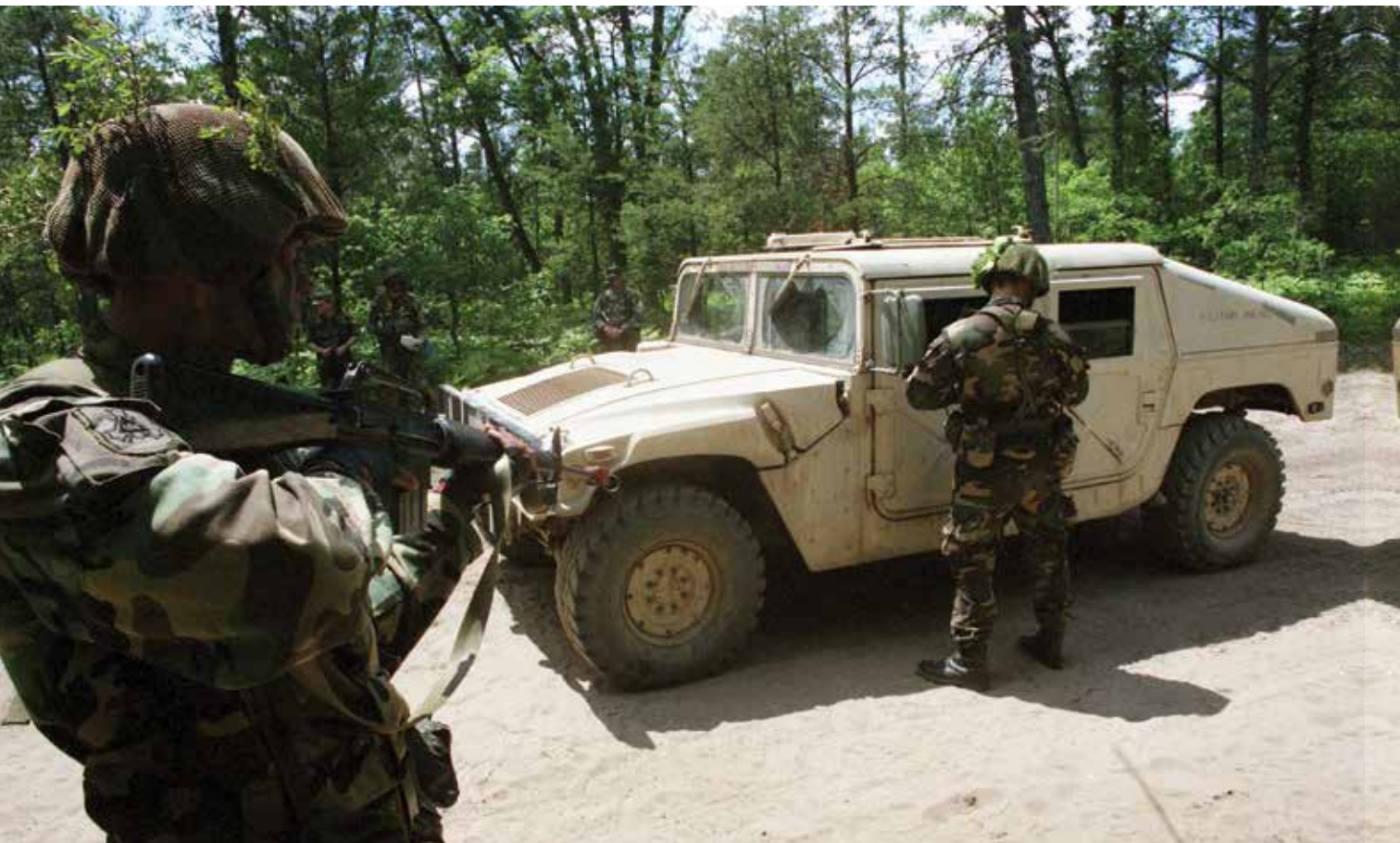
Lietuvos kariai pratybose Luizianoje. Jungtinės Amerikos Valstijos, 1995 m. Lithuanian soldiers at an exercise in Louisiana, the United States of America, 1995.