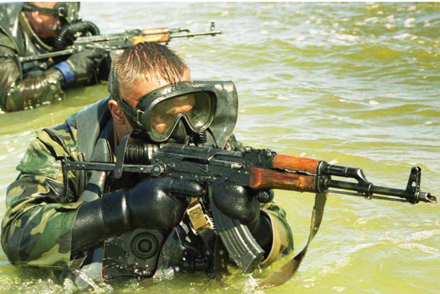
Per parodomąsias pratybas. 1999 m. A dynamic display. 1999.