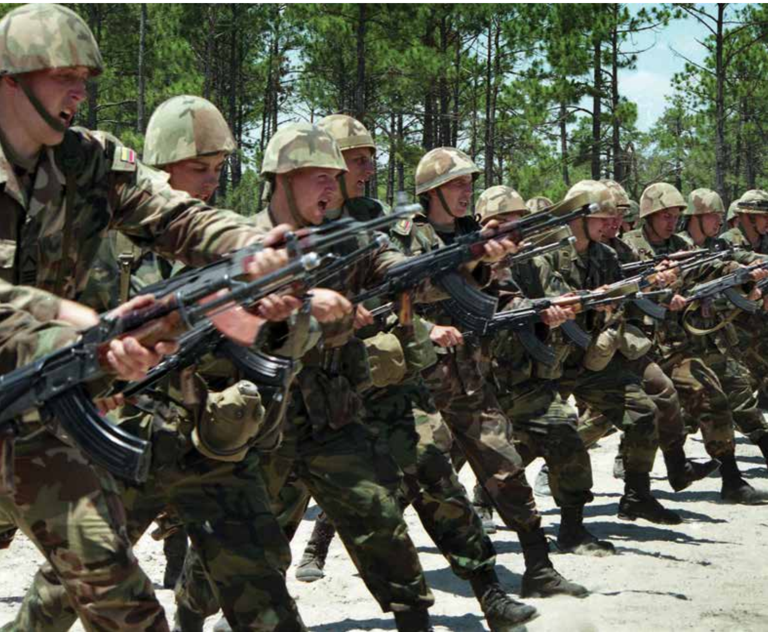
Dragūnų bataliono kariai. Jungtinės Amerikos Valstijos, 1998 m. birželis

Members of the Dragoon Battalion, the United States of America. June 1998