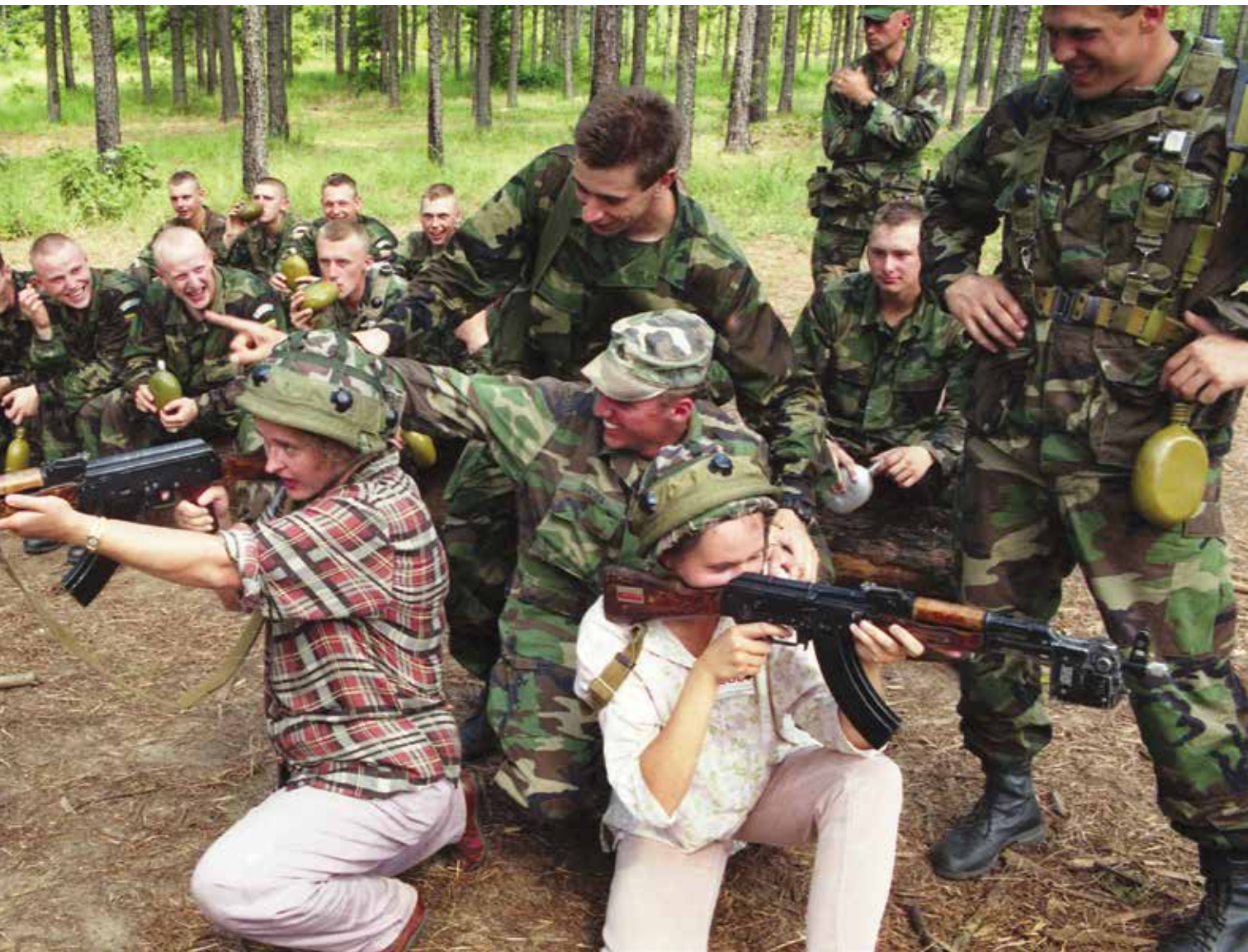
Lietuvos kariai pratybose Luizianoje. Jungtinės Amerikos Valstijos, 1995 m. Lithuanian soldiers at an exercise in Louisiana, the United States of America, 1995.