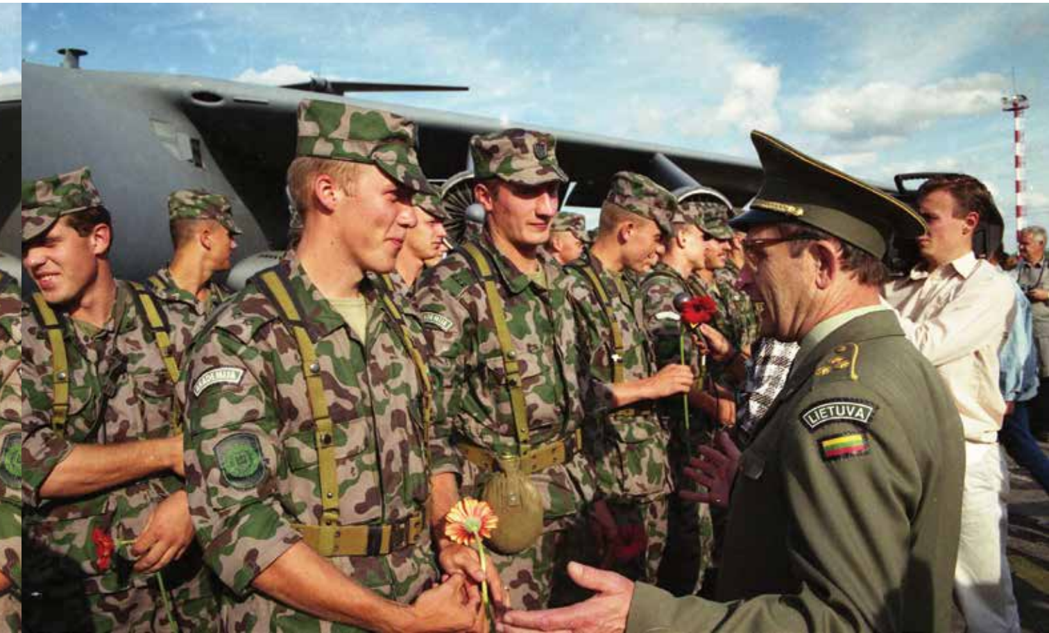
Lietuvos kariai, grįžę iš pratybų Luizianoje (JAV). Vilnius, 1995 m. Lithuanian soldiers after returning from an exercise in the State of Louisiana, U.S.A. 1995, Vilnius