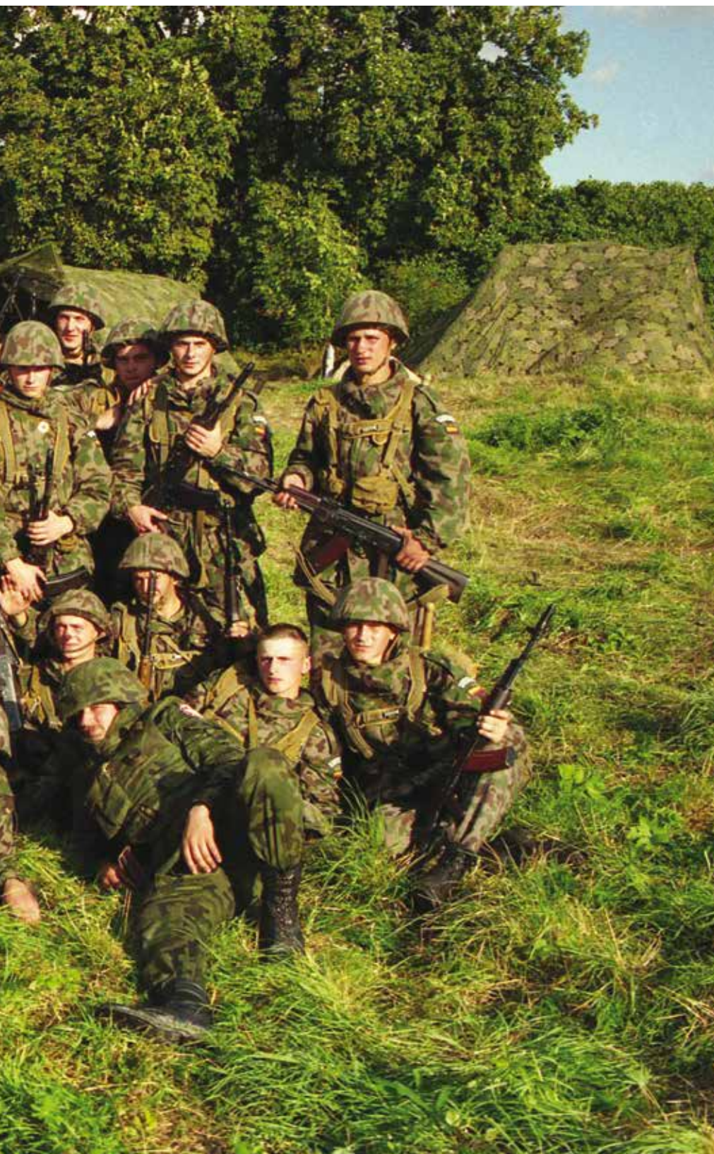
Pratybos Lenkijoje. 1999 m. A military exercise in Poland. 1999.