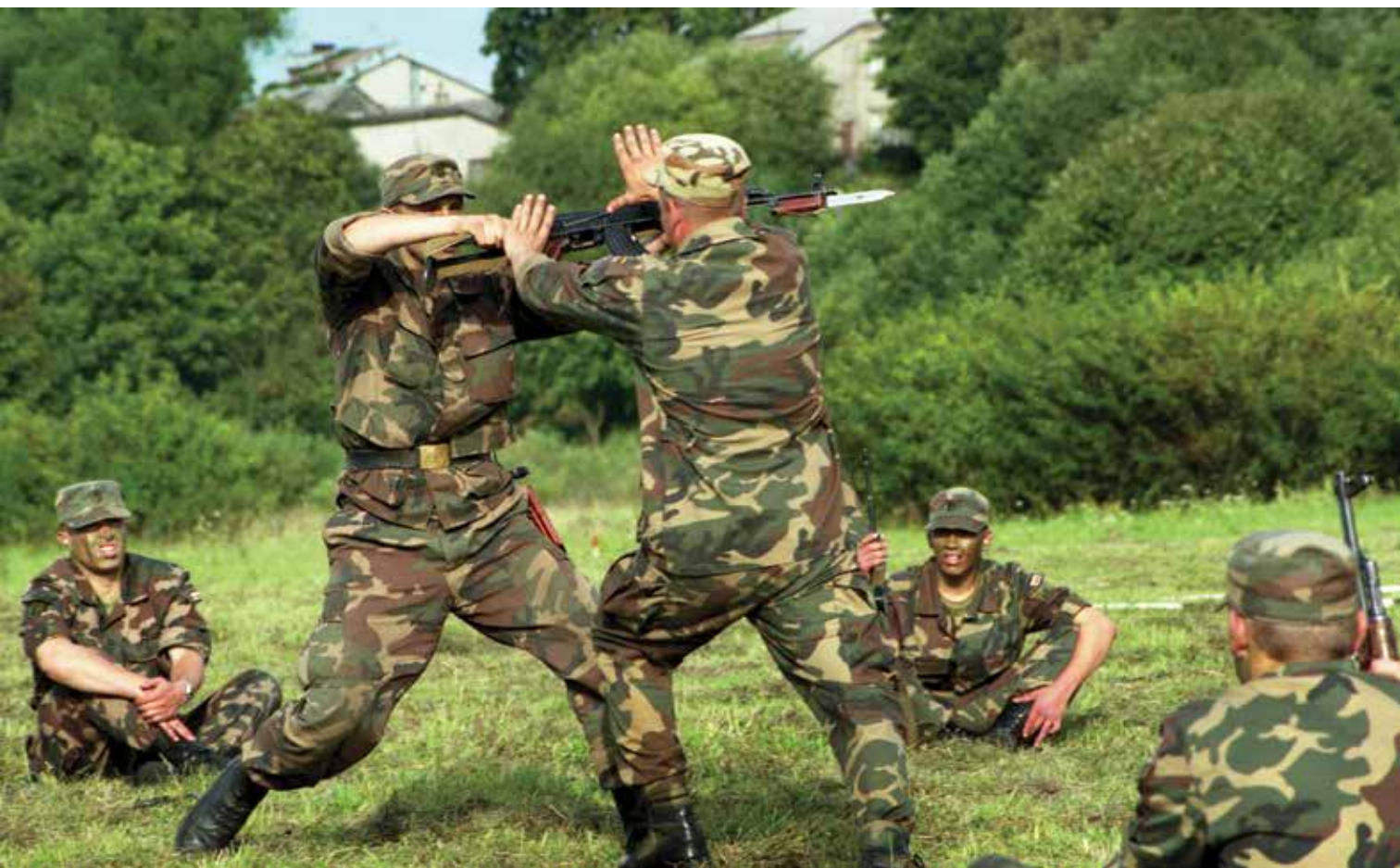
Per parodomąsias pratybas. 1999 m. A dynamic display, 1999 m.