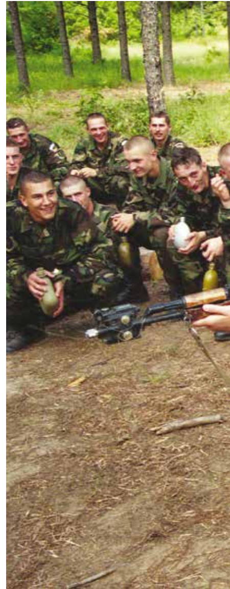
Lietuvos kariai pratybose Luizianoje. Jungtinės Amerikos Valstijos, 1995 m. Lithuanian soldiers at an exercise in Louisiana, the United States of America, 1995.