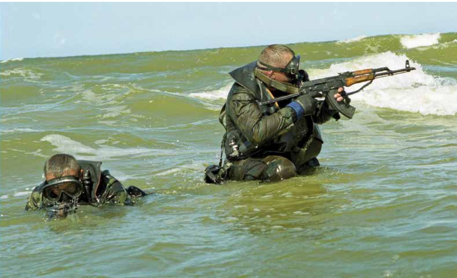
Lietuvos ir Jungtinių Amerikos Valstijų karių narių pratybos Klaipėdoje. 2000 m. birželis

Lithuanian and U.S. military divers at an exercise in Klaipėda. June 2000